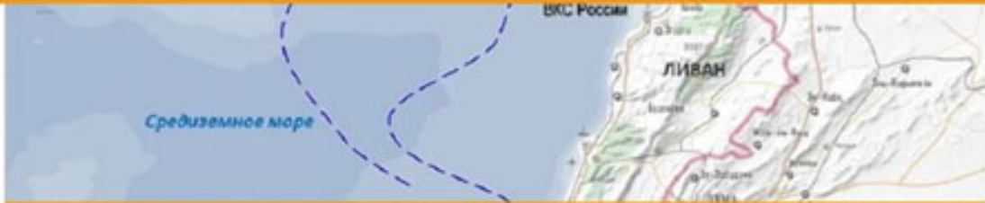
Map of the incident on September 17 in Syria

Israel's Embassy in Moscow has refused to comment on Russian Military's statement on Il-20 crash.